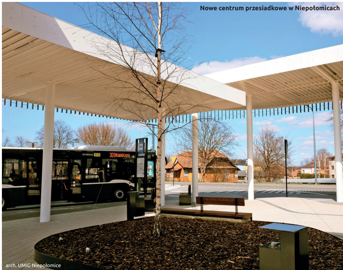
arch. UMIG Niepołomicie

Niepołomicie w relacji z KrOF". Została zrealizowana w ramach Zintegrowanych Inwestycji Terytorialnych. Prace są współfinansowane w ramach Regionalnego Programu Operacyjnego Województwa Małopolskiego na lata 2014-2020, dotyczącego niskoemisyjnego transportu miejskiego ZIT.